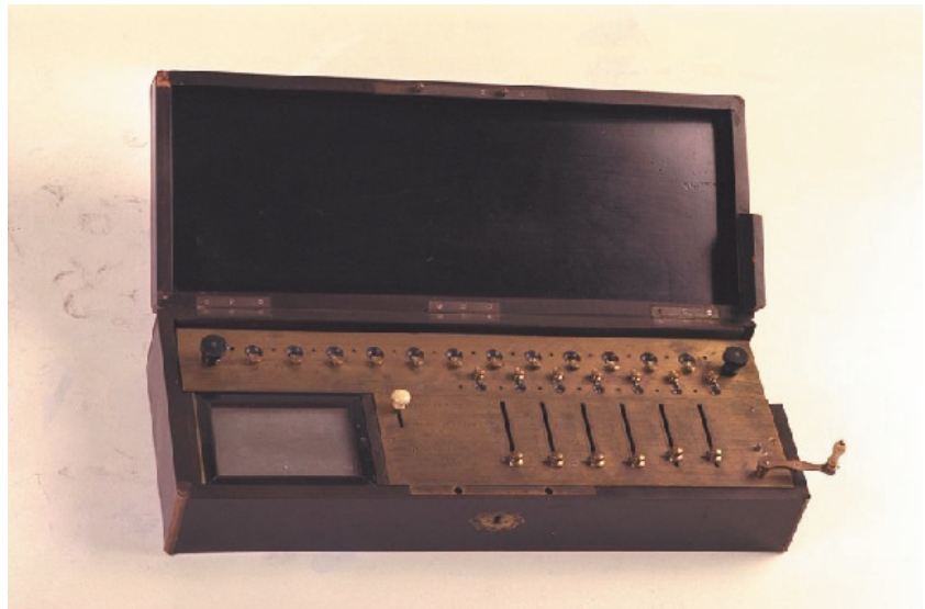
Abb. : Arithmomètre von 1870 ermöglicht alle vier Grundrechenarten.

Die ersten maschinell in Serie gefertigten Rechenmaschinen der Welt gehen auf Charles Xavier Thomas (1785 - 1870) aus Paris zurück. Für sein Arithmomètre, das nach dem von Leibniz erfundenen Staffelwalzenprinzip arbeitet, erwarb er 1820 das Patent. In 60 Jahren wurden rund 1500 Rechenmaschinen dieser Art hergestellt.